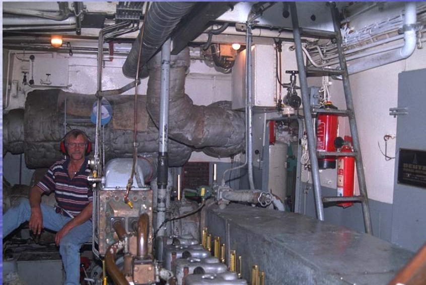
Neue Maschine 1971