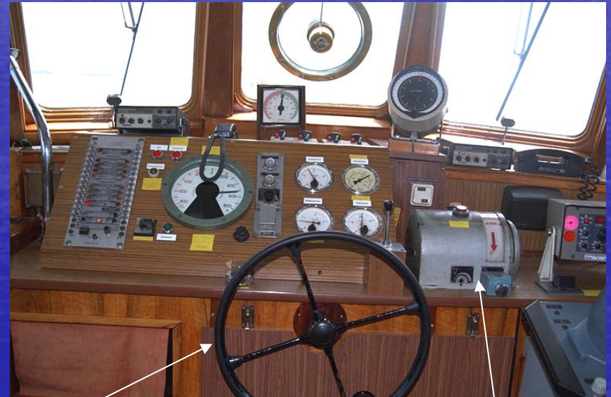
Hydraulische Ruderanlage und pneumatische Maschinenumsteuerung